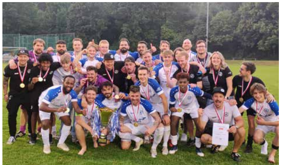
Sieg des SC Breitenwang/Zweigverein Fußball beim Cupfinale.