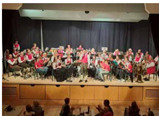
Platzkonzert im VZ und am Plansee