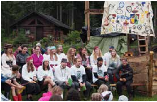
Zeltlager Jungschar Breitenwang/Reutte