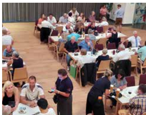
60-Jahr-Jubiläum SCB Stocksport