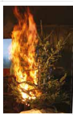
4 Sekunden ... kann sich ein trockener Christbaum...