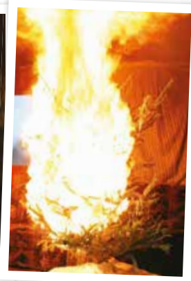
6 Sekunden ... mit einer Stichflamme entzünden!