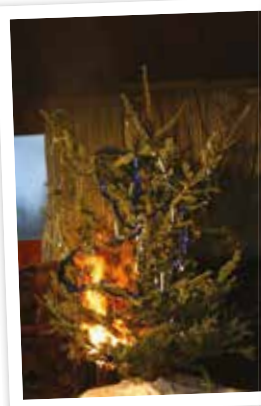
2 Sekunden In nur sechs Sekunden...